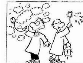
A Weil Kinder gern zündeln und mit Wasser spritzen