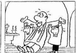
B Um den Pfarrer bei der Messe zu unterstützen